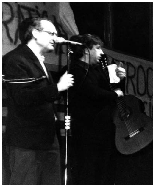
Recital de Raimon als Padres l'any 1973. Arxiu AVV de Sant Andreu de Palomar.

No, per no enfrontar-se, suposo. Però van tirar enrere, i això que defensàvem els diners de l'Ajuntament [riu]. Hi havia manifestacions fortes. La dels diners, la de l'Estatut va ser molt gran.